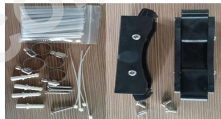
Accesorios habituales (montaje en poste)