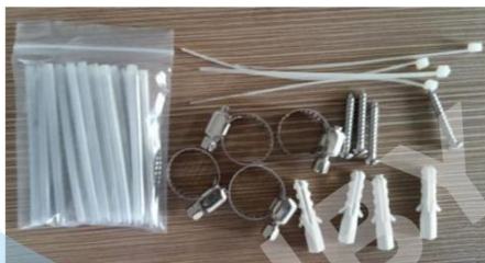
Accesorios habituales (montaje en pared)